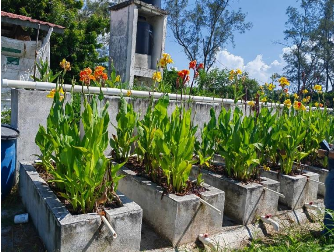
Figura 2. Desarrollo Vegetativo