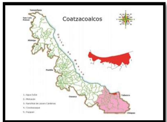
Figura 1. Ubicación Geográfica de Coatzacoalcos, Veracruz, México.

El municipio de Coatzacoalcos es un complejo urbano que posee una superficie de 471.16 \text{ km}^2 , lo que representa el 1% del total del estado. Su ubicación estratégica radica en la apertura hacia el Golfo de México y por su cercanía con el océano pacífico, lo que facilita su conexión con el país y el resto del mundo. Localizado en la zona sur del estado de Veracruz, a una altura de 10 \text{ m} sobre el nivel del mar, en las coordenadas de latitud norte 18^{\circ}19 y longitud oeste 94^{\circ}26 , (Figura 1.), limita con los municipios de Pajápan, Cosoleacaque, Minatitlán, Ixhuatán del sureste, Moloacán y las Choapas; al norte con el estado de México y al este con el estado de tabasco (Barcelata, 2012)